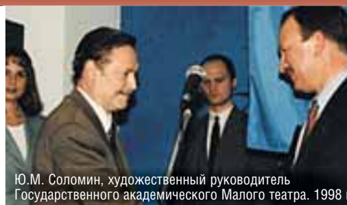
Ю.М. Соломин, художественный руководитель Государственного академического Малого театра. 1998 г.