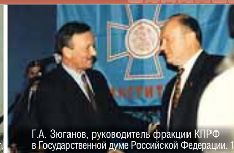
Г.А. Зюганов, руководитель фракции КПРФ в Государственной думе Российской Федерации. 1998 г.