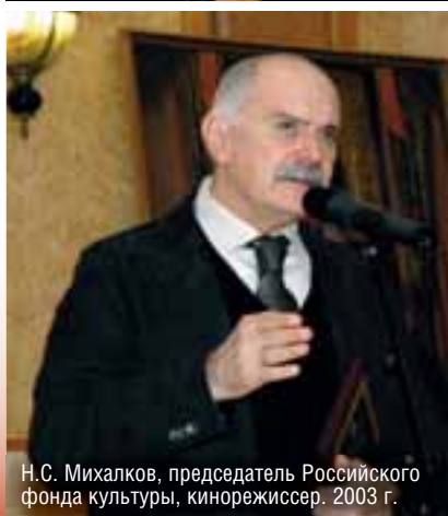
Н.С. Михалков, председатель Российского фонда культуры, кинорежиссер. 2003 г.