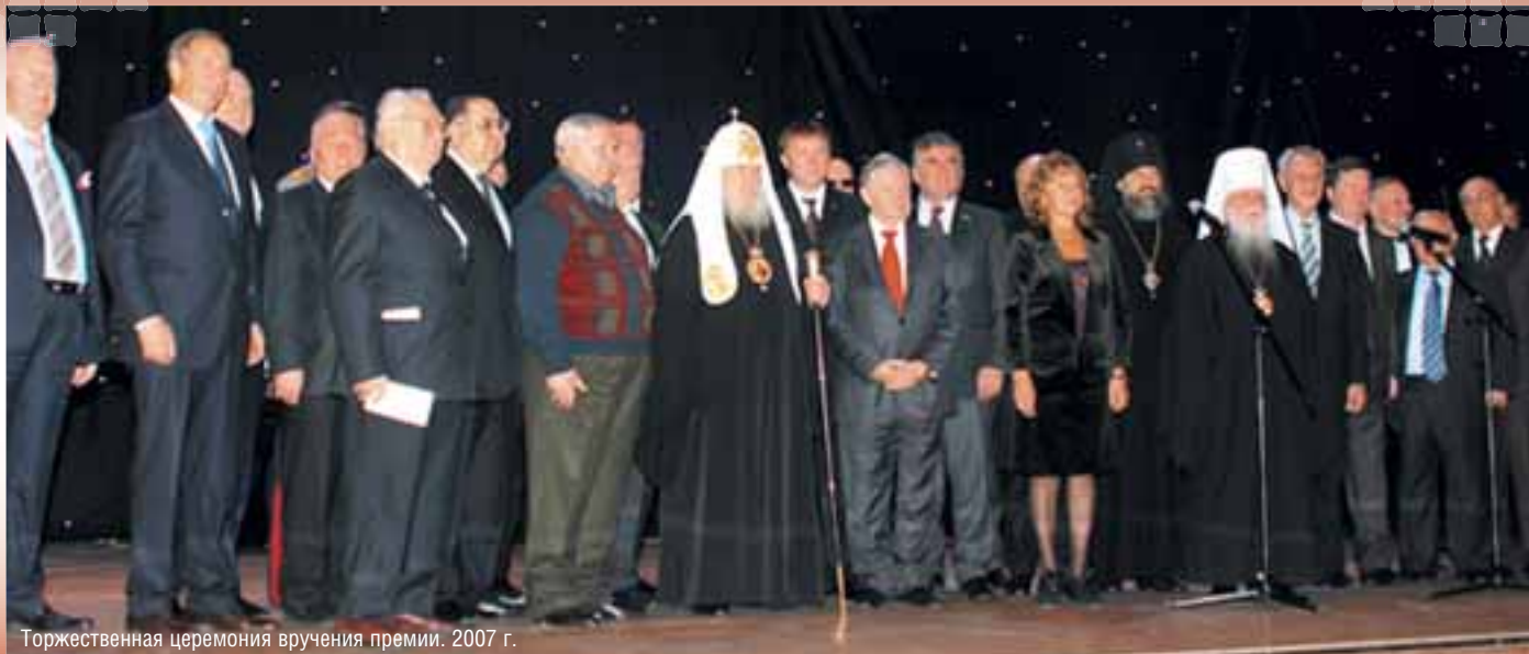
Торжественная церемония вручения премии. 2007 г.

на нашей страны от беспамьятства, оборона от потери своей истории, это защита ее от идеологического влияния извне, которое навязывает нам другие стандарты и потерю самоидентификации. Поэтому сегодня мы занимаемся все тем же — мы занимаемся обороной. Спасибо большое за эту повторную высокую награду! Служу России и Русской Православной Церкви. Низкий поклон».