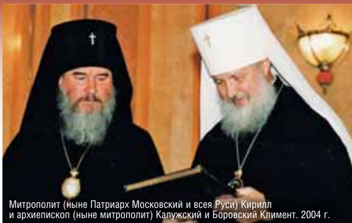
Митрополит (ныне Патриарх Московский и всяя Руси) Кирилл и архиепископ (ныне митрополит) Калужский и Боровский Климент. 2004 г.