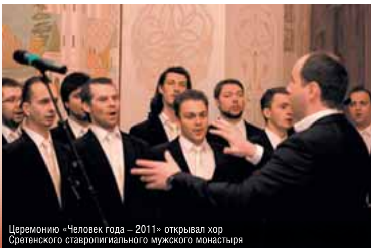
Церемонию «Человек года – 2011» открывал хор Сретенского ставропигиального мужского монастыря