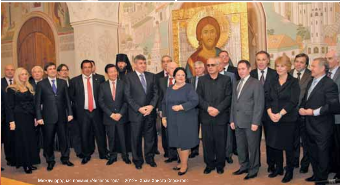
Международная премия «Человек года – 2012». Храм Христа Спасителя