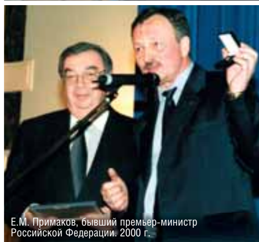
Е.М. Примаков, бывший премьер-министр Российской Федерации. 2000 г.